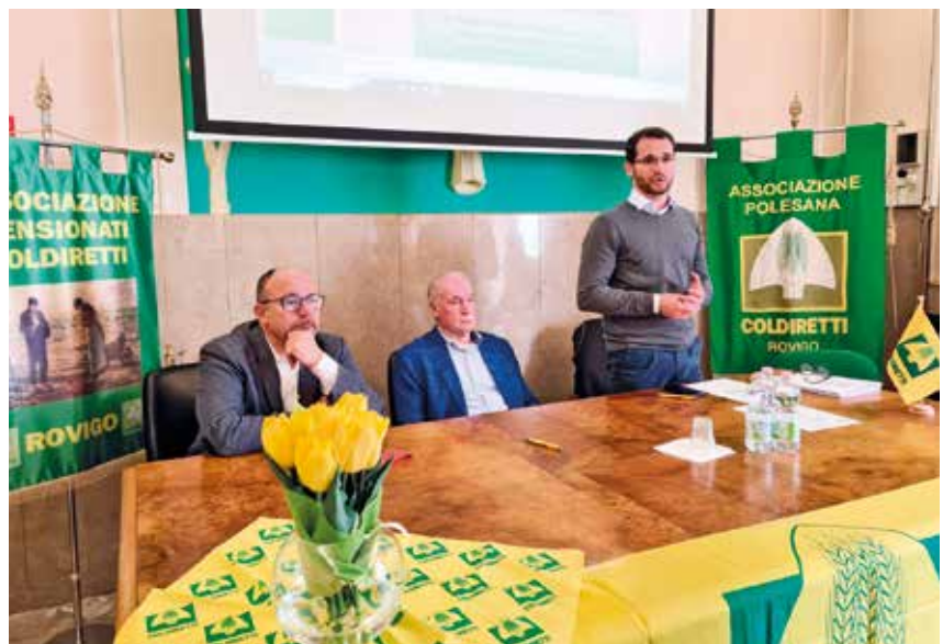
Un momento dell'assemblea elettiva