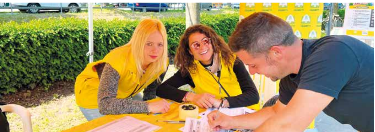
La raccolta firme di Coldiretti

esponenti di ogni schieramento hanno sostenuto la proposta in modo bipartisan. Ed è stata Coldiretti per prima ad accendere i riflettori su un business in mano a pochi ricchi e influenti nel mondo che fino ad ora era tenuto nascosto”. Coldiretti sta proseguendo sia nella raccolta firme che delle delibere delle amministrazioni pubbliche.