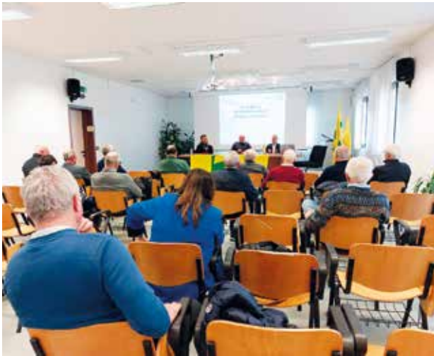
Assemblea di Rovigo

A cura di Paolo Casaro, Responsabile provincia Epaca