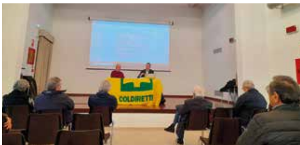
Assemblea di Castelmasza e Fiesso