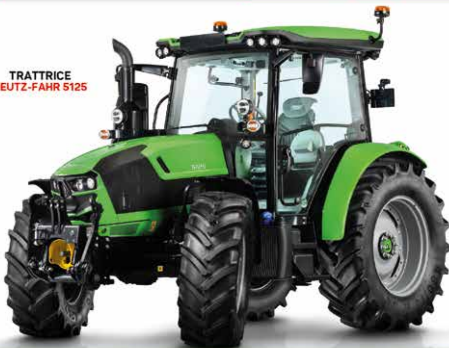
TRATTRICE DEUTZ-FAHR 5125