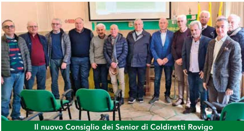
Il nuovo Consiglio dei Senior di Coldiretti Rovigo