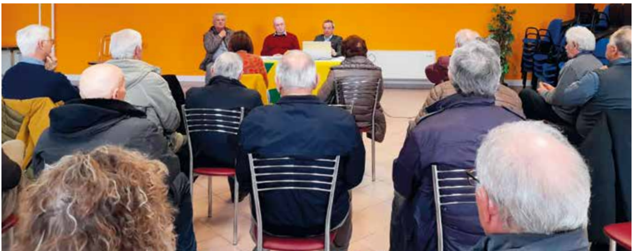
Assemblea di Badia e Lendinara