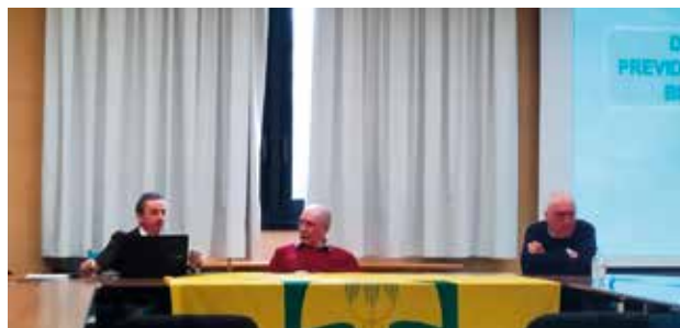
Assemblea di Adria

di una particolare tutela da parte del legislatore, a condizione di aver raggiunto il 63° anno di età unitamente ad almeno 30 o 36 anni di contributi.