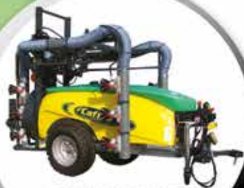
POLVERIZZATORE PNEUMATICO CAFFINI REFAL